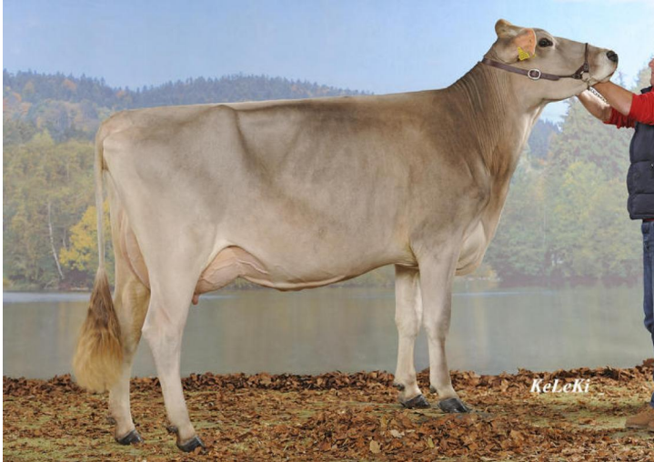
Fischli's Top Present PREMANA