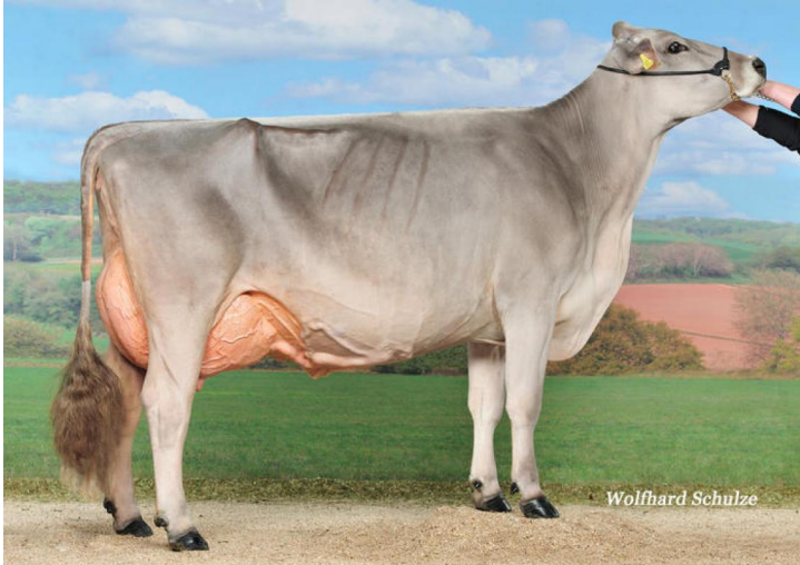
Global View Alibaba JASMIN